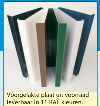
Voorgelakte plaat uit voorraad leverbaar in 11 RAL kleuren.