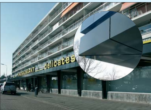
Luifel met watergeleiding aan winkelcentrum.