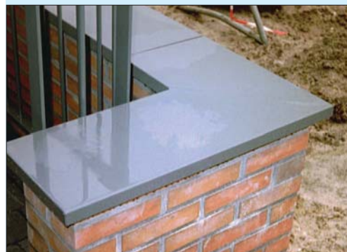
Afdekelementen voor terrasmuurtje.