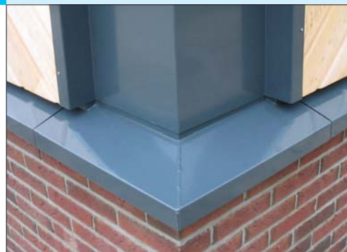
Vensterbank met hoekelement.