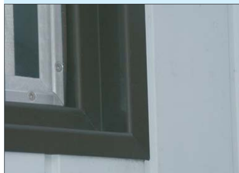
Afwerkrand rondom kozijn.