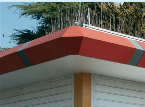
Daklijst met watergeleiding aan bedrijfspand.